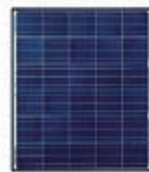
30W 656mm × 755mm

多結晶モジュールの採用により、太陽の光エネルギーを効率よく電気エネルギーに変換します。ランプのワット数や点灯時間、日照条件などにあわせて、太陽電池パネルの枚数の追加、蓄電池の容量UPができます。